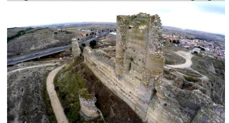
Castillo de Fuentidueña de Tajo