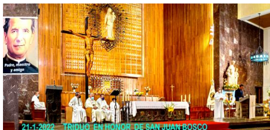
21-1-2022 TRIDUO EN HONOR DE SAN JUAN BOSCO

Para fin de fiesta, convivencia de los asistentes, toda la Familia Salesiana, en el comedor de alumnos del colegio.