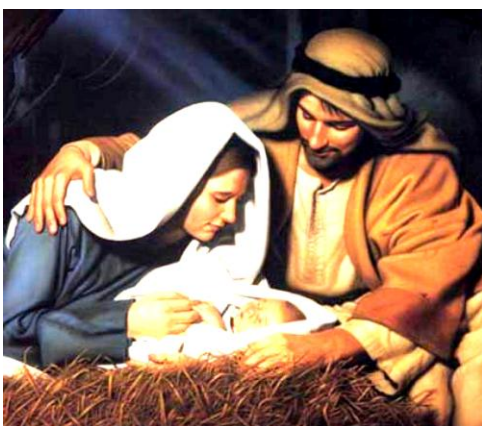
Jesús nace en Belén.

Que también nazca en nuestros corazones para sembrar la paz y el bien a nuestro alrededor.